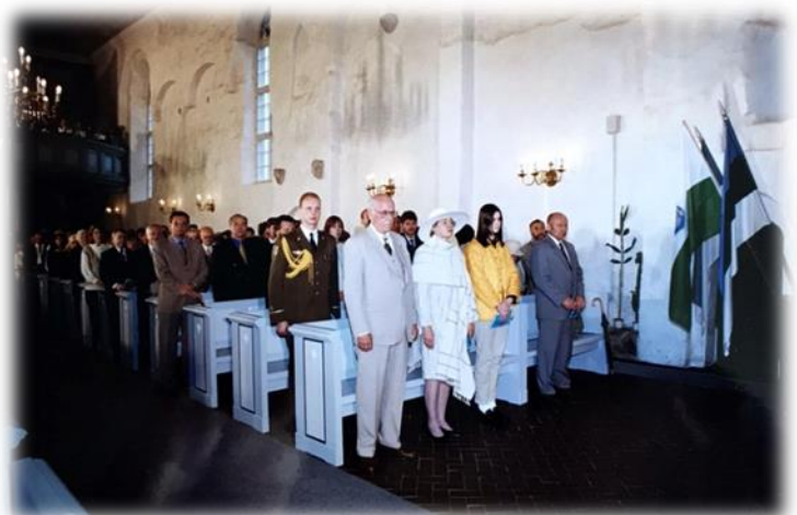
Võidupüha jumalateenistus Viljandi Jaani kirikus, teenistusel osales president Lennart Meri

Sellised mõtted ja meenutused ajast, mil olin aktiivselt koguduses tegev, oli rõõmu ja muret. Praegu pühapäeviti kirikus käies tunnen suurt rõõmu- ja tänutunnet, aga silma jäävad ka pragunevad ja määrdunud lagi ning seinad. Loodan ja palun, et Jumal annab tänastele töötajatele jõudu meie kodukiriku hoidmisel.