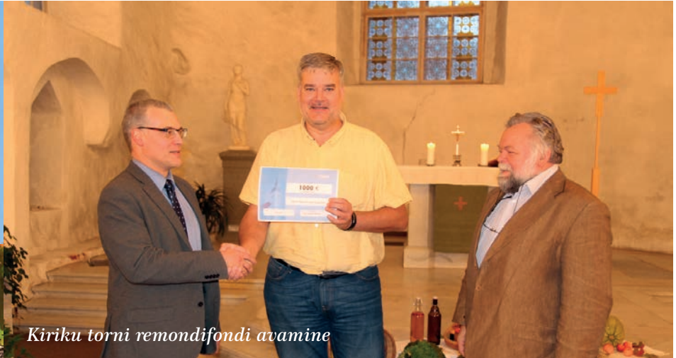
Kiriku torni remondifondi avamine