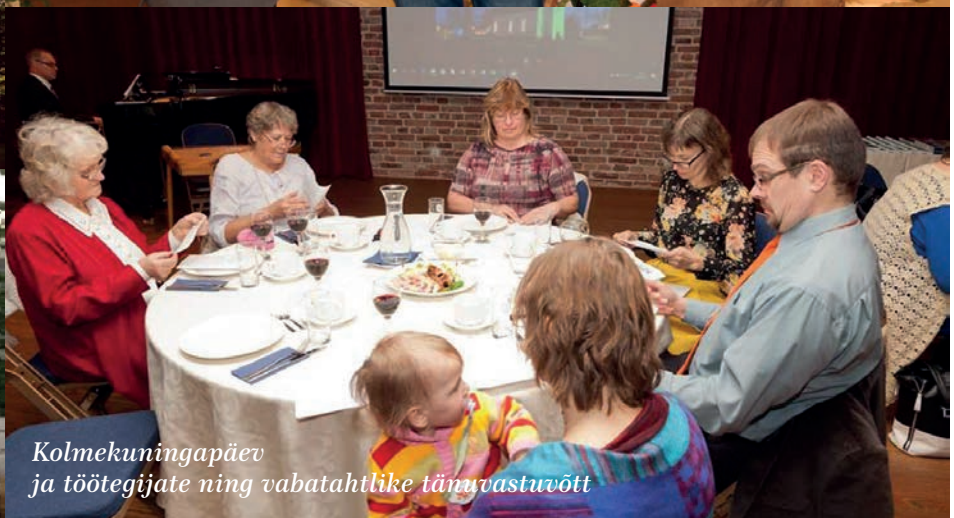
Kolmekuningapäev ja töötajate ning vabatahtlike tänavastuvõtt