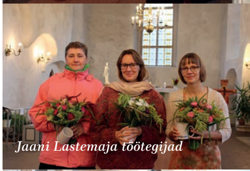
Jaani Lastemaja töötajad