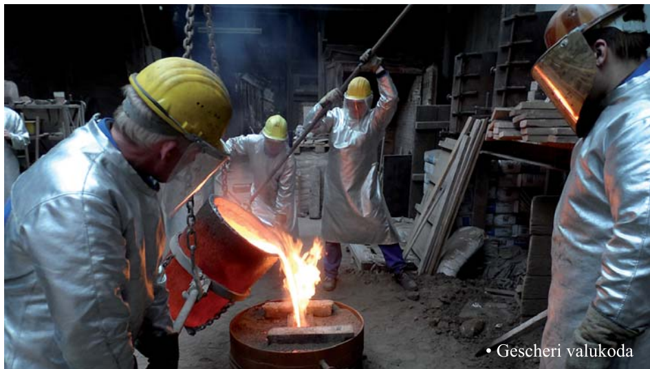
• Gescheri valukoda

II nelipühäl tõsteti Frantsiskus ja Johannes linnapea ja koguduseliikmete osavõtul pidulikult Jaani kiriku torni.