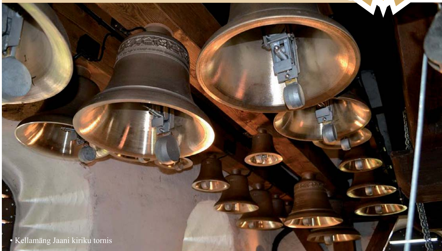
• Kellamäng Jaani kiriku tornis