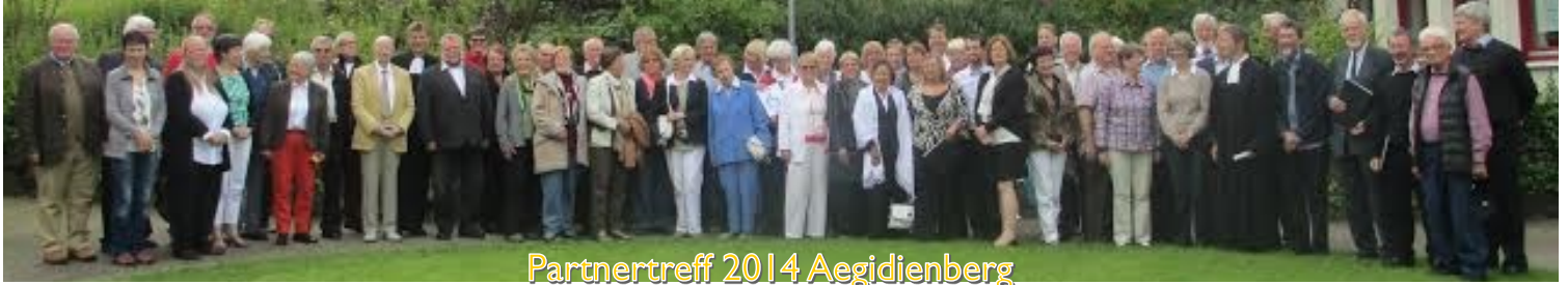
Partnertreff 2014 Aegidienberg