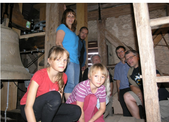
Huvilised Kuusalu kirikutornis kelli kaemas

Kokkuvõttes on olukord järgmine: kirikukelli helistatakse harva, üksnes jumalateenistuste, matuste ja laulatuste eel ja järel, kellade kõla on tänu vananenud helistamissüsteemile ja mõradele tuhm ning lahendamata on heli tornist välja pääsemine.